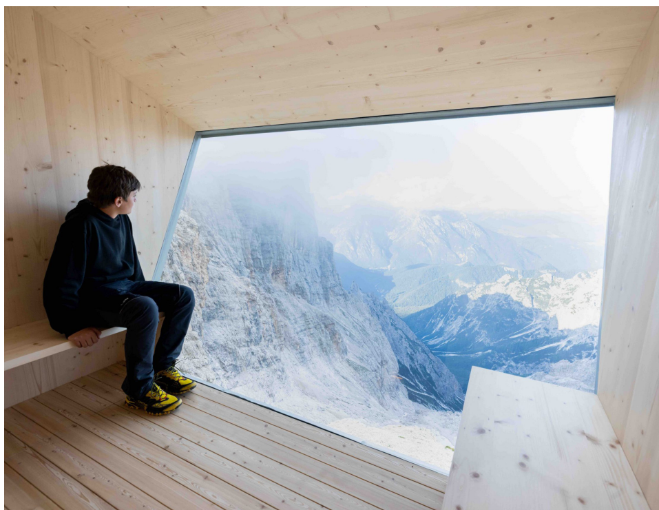
Demogo, Bivacco Fanton alle Marmarole, Auronzo di Cadore (Belluno)

Lancio Concorso di progettazione per la ricostruzione dei bivacchi della Sezione CAI Fiamme Gialle