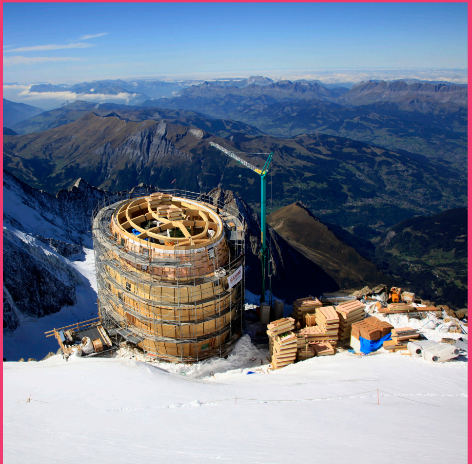
Groupe-H, Rifugio Goûter in cantiere, Monte Bianco

L'attività sarà seguita dai tutor del gruppo di ricerca dell'Istituto di Architettura montana del Politecnico di Torino e vedrà la presenza di ospiti che approfondiranno aspetti specialistici.